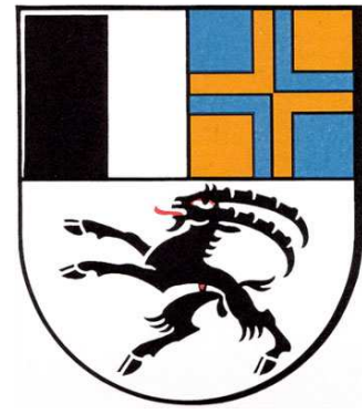
Kanton Graubünden 1803

Im Jahre 1499 rächten sich die Österreicher im Münstertal und im Engadin für die blutige Niederlage an der Calven und für die unrühmlichen Plünderungen und Mordtaten der bündnerischen Kriegshorden im Vinschgau.