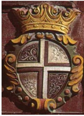
Grauer Bund 1424