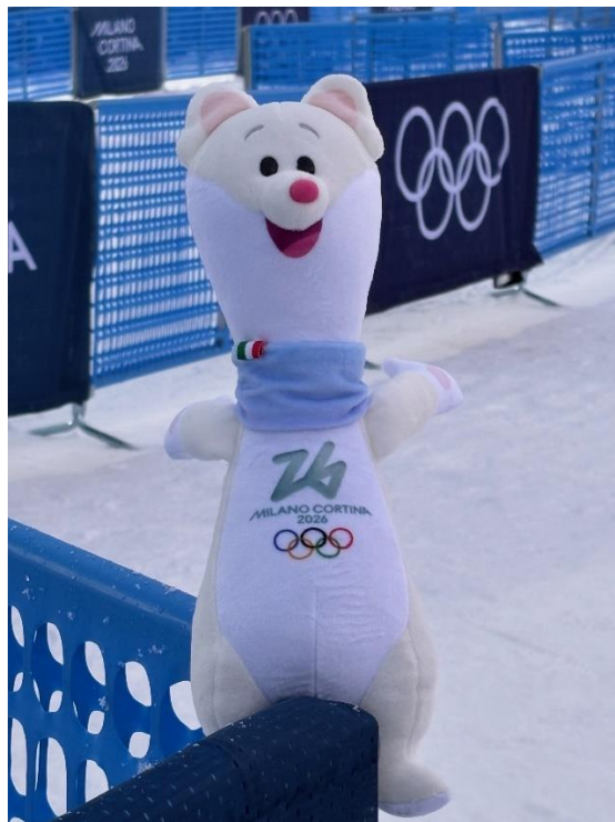
Livigno im Olympiefieber mit dem sympathischen Maskottchen