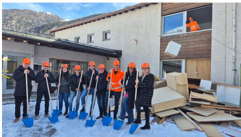
Spatenstich Sanierung Schulhaus Val Müstair 2026